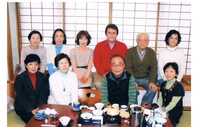
「英会話ハッピークラブ」