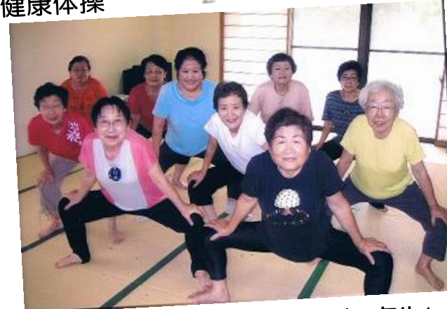
「健康体操自彊術普及会健自サークル」