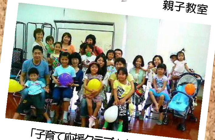
「子育て応援クラブ☆むくむく」