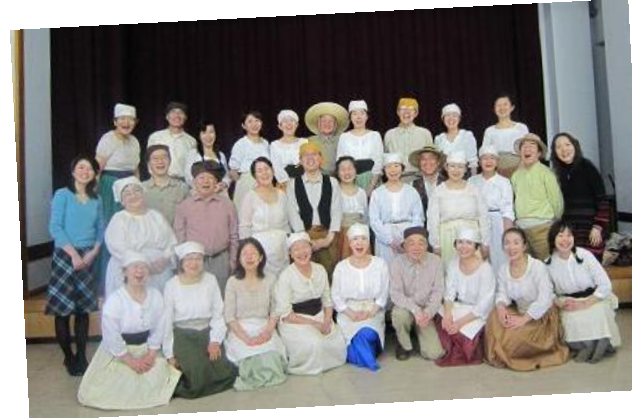
「わらびオペラ合唱団」