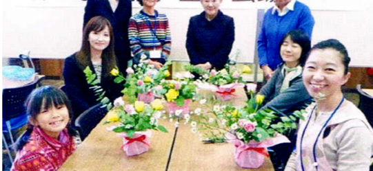
2012年度文化祭参加「彩の花」展 体験教室会場