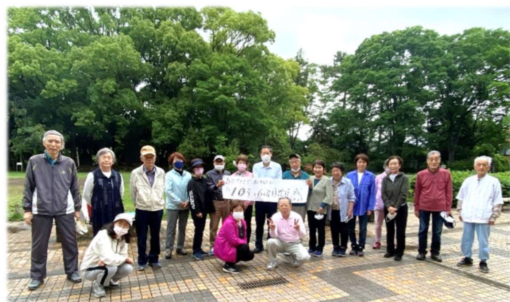
平成24年1月2日発会 祝10周年

10年前の真冬の1月2日の早朝6時は真っ暗で、参加される方がいらっしゃるか不安でしたが、当日は6名が集ってくれました。今でもその時の感動は忘れられません。そして本日、令和4年5月23日は27名がご参加くださいました。発会から10年、週3回の活動を少しでも皆さまの健康にお役立てになればとの想いでこれからも続けて行きたいと思っております。