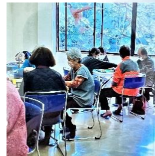
けやき健康麻雀(けやき荘)