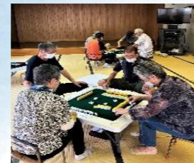
北町健康麻雀カレッジ(北町公民館)