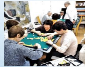
中央麻雀カレッジ(中央5丁目)