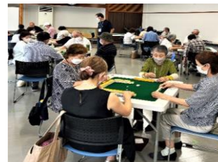
松原健康麻雀カレッジ(松原会館)