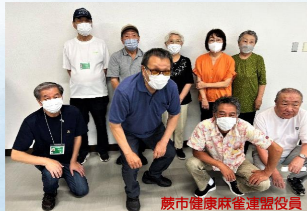
蕨市健康麻雀連盟役員