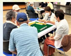
わらび健康麻雀カレッジ(中央公民館)