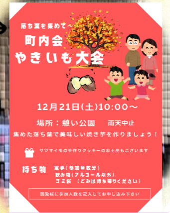
参加された方の作品